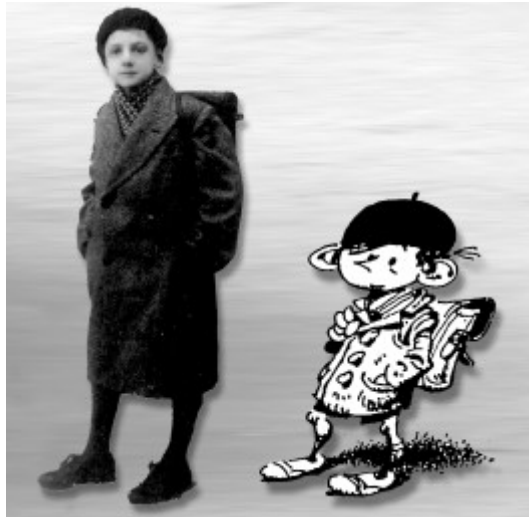
Oben: Franquin als Schüler, ca. 1930. © Franquin