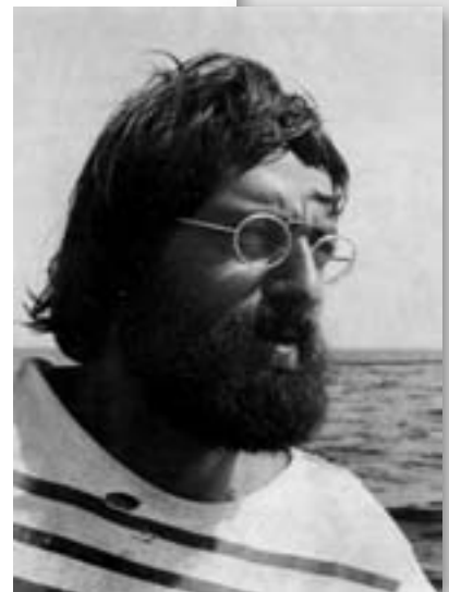
François Bourgeon, 1979. © Glénat