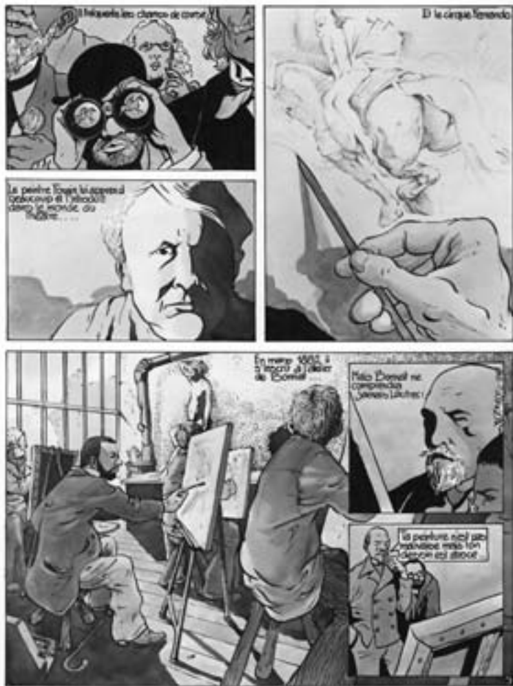
Unten: Magica in Djin , 1976. © Bourgeon - Fleurus